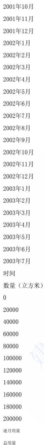
图5-9 砂石料逐月供应计划直方图